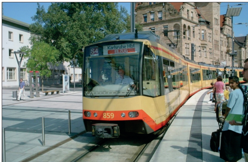
1. ábra: A Karlsruhei vasút villamos

A gyorsan fejlődő nagyvárosok körzetében gazdasági kényszer formájában továbbra is fennállt az igény, az urbanizálódó települések belső kerületeit az élelmiszerekkel, kisipari termékekkel és munkaerővel ellátó, környékbeli helységekkel való közvetlen vasúti kapcsolat kiépítésére. Az 1880. évi XXXI. törvény-cikk adta lehetőségeket kihasználva a főváros területén kiterjedt közúti lóvasút hálózatot üzemben tartó Budapesti Közúti Vaspálya Társaság (BKVT) Igazgatósága az elsők között kezdeményezte a város határáig vezető vonalainak folytatásaként üzemelő, Budapesti Helyi érdekű Vasutak (BHÉV) hálózatának kiépítését. Így került sor 1887. augusztus 7-én a Budapest–Soroksár, 1887. november 24-én a Soroksár–Haraszti, 1888. július 20-án