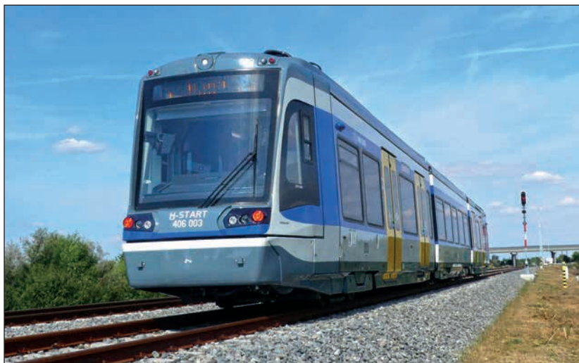
2. ábra: A MÁV-START megrendelésére gyártott Stadler Train tram hibrid jármű

A forgóvázkeret a kívánt geometriai megvalósítása és a szilárdsági követelmények teljesítése végett