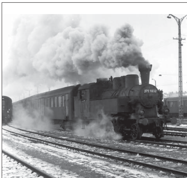
2. ábra: MÁV 375-ös

125 éve az utolsó import teherkocsikat (K 51076 – 51240) a Nesseldorf-i vagongyártól szerezte be a MÁV. Ebből a szériából az 51077-es pályaszámút sikerült védetté nyilvánítani és épp néhány hete került ismét vágányra Istvántelken.