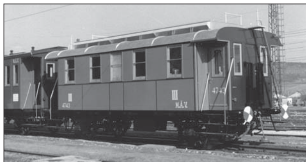
1. ábra: a MÁV Ch 4743 pályaszámú kocsija 1892-ben a Ganz és Társa Vasúti kocsigyárban készült