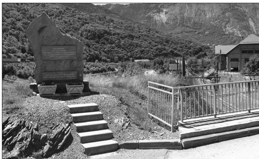
5. ábra: La Saussaz, a baleset emlékhelye