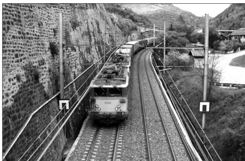
6. ábra: Kép a baleset helyszínéről 90 évvel később

A bíróság ezt a helyzetet, a katonai parancsnok hatásköri túllépését értékelve a mozdonyvezetőt, aki a balesetből megmenekült, felmentette. Magát az eseményt viszont katonai titokká minősítették.