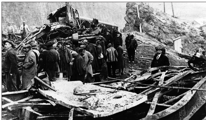
4. ábra: Kép a baleset helyszínéről