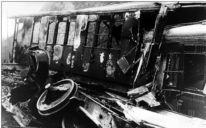
2. ábra: Kép a baleset helyszínéről

150 km/h sebesség elérése után az Orelle és Saint-Michel-de-Maurienne közötti szakaszon kisiklott.