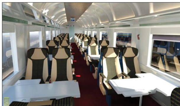
4. ábra A MÁV-Gépészet Zrt. bemutatta a harmadik generációs személykocsi prototípusának látványterveit. A képen egy lehetséges belső tér kialakítás látható.