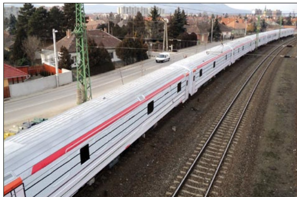
2. ábra Útnak indult Norvégiába a befőliázott szerelvény

Ez a STADLER gyártotta modern mozdony az SBB Cargo megrendelésére készült 30 mozdony első járműve. Az Ee 923-asokat tolató és vonali szolgálatra rendelték. A STADLER Ee 922 és az Ee 923 mozdonyokat a Vasútgépészetben bemutatni tervezzük.