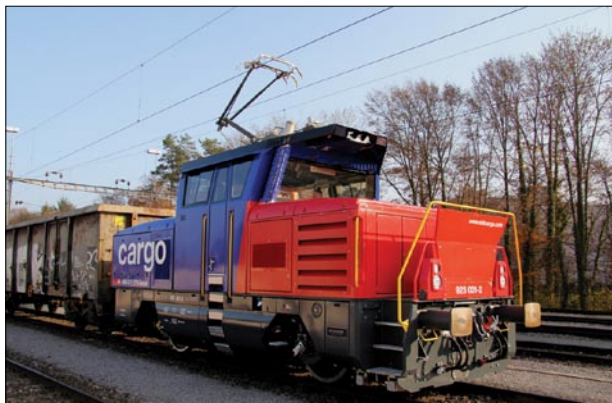
1. ábra Az SBB Cargo üzembe helyezte első kettős erőforrási tolatómozdonyát.

Ez a STADLER gyártotta modern mozdony az SBB Cargo megrendelésére készült 30 mozdony első járműve. Az Ee 923-asokat tolató és vonali szolgálatra rendelték. A STADLER Ee 922 és az Ee 923 mozdonyokat a Vasútgépészetben bemutatni tervezzük.