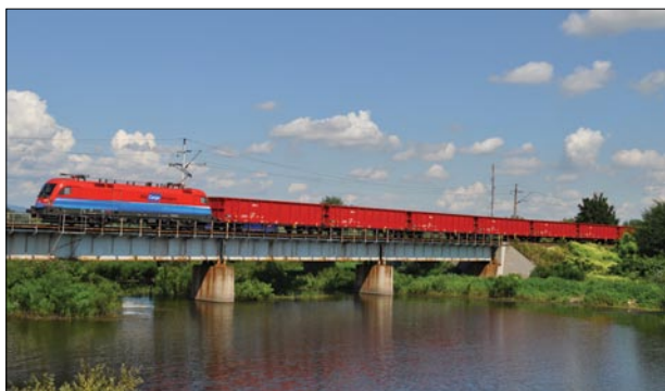
3. ábra A TS Hungária Kft.-ben, Miskolcon tovább folytatódik a képen látható Eans típusú teherkocsik gyártása. A megrendelés szerint összesen 200 készül belőle.

A Norvég Vasút átvette a negyedik Dunakeszin felújított szerelvényt. Az átadott szerelvény négy másodosztályú, egy első osztályú, egy gyermekjátászóteret magában foglaló családi kocsiból és egy bisztrókocsiból áll. Ezekkel együtt összesen már 31 kocsi állt forgalomba Norvégiában.